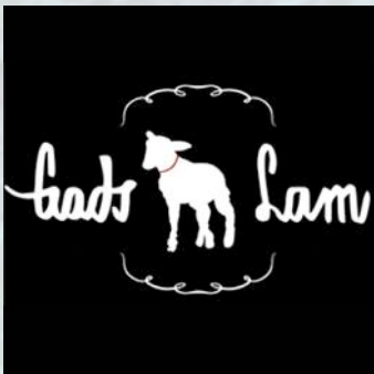
Figuur 2: Beeldmerk film Gods Lam