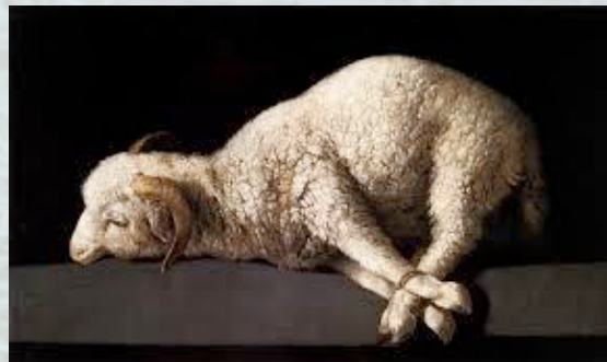
Figuur 3: Francisco Zurbarán - Cordero de Dios