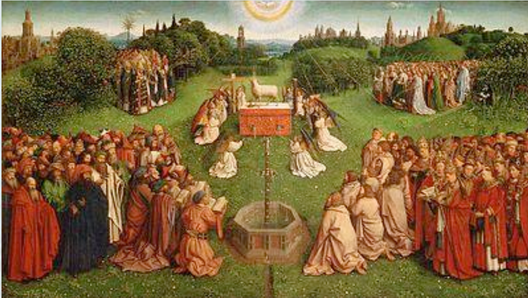
Figuur 1: Jan van Eyck – De aanbidding van het Lam Gods